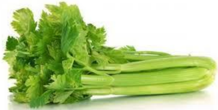
xī qín 西芹