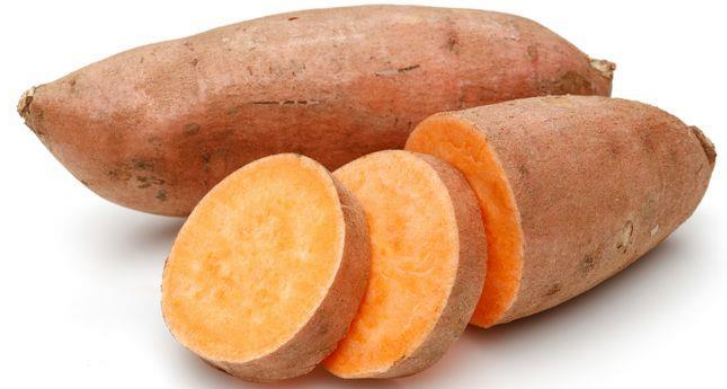
hóng shǔ dì guā 红薯 / 地瓜