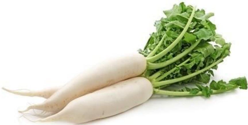
luó bo 萝卜