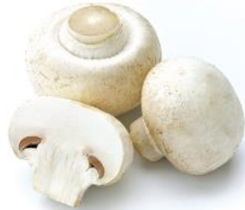
mó gu 蘑菇