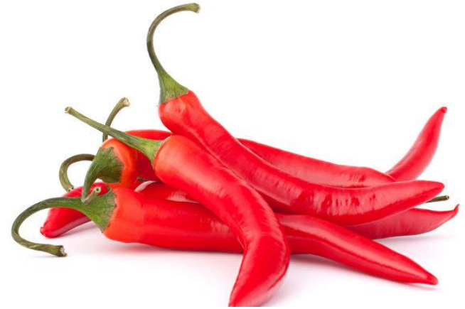
là jiāo 辣 椒