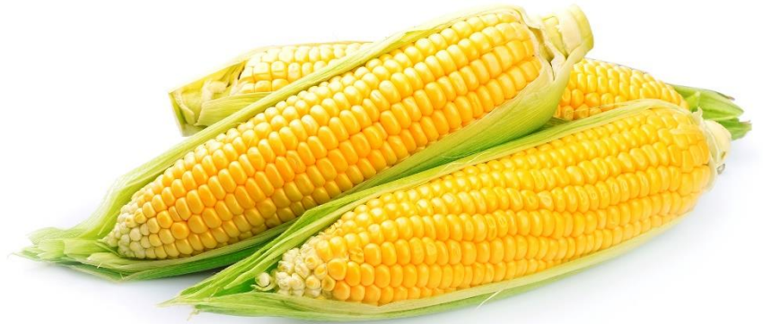
yù mǐ 玉 米