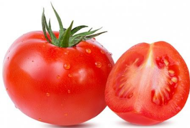
fān qié 番 茄