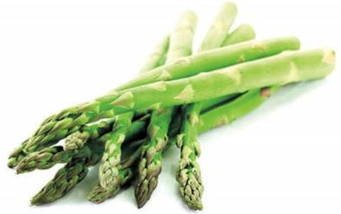
lú sǔn 芦笋