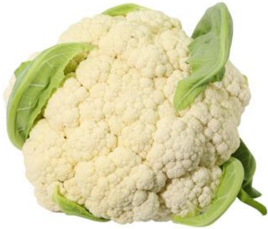
bái cài huā 白 菜 花