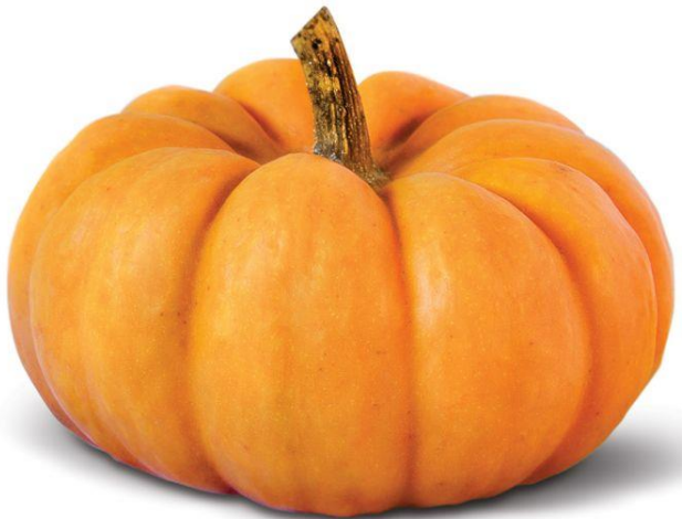
nán guā 南 瓜