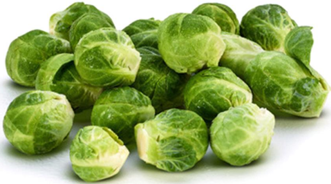
yǔ yī gān lán 羽衣甘蓝