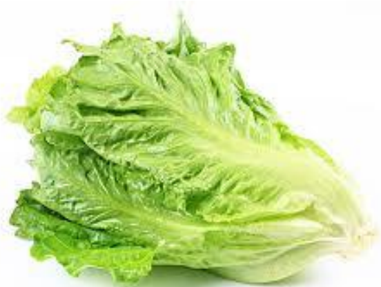
shēng cài 生菜