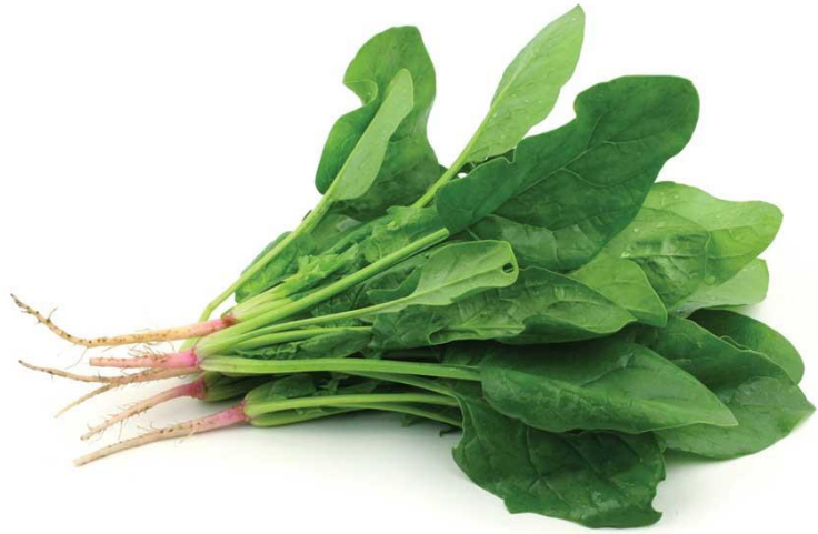
bō cài 菠菜