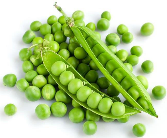
wān dòu 豌豆